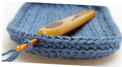
Her startes på Overstykket.