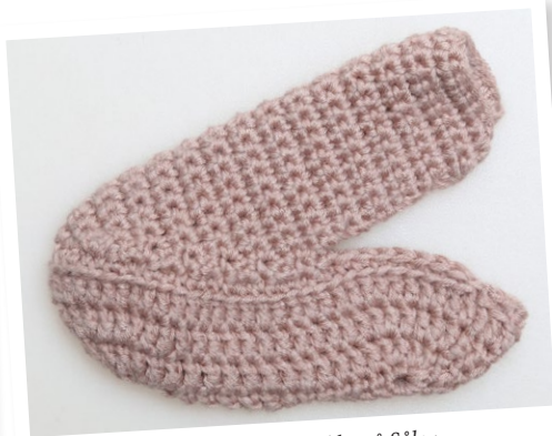
Det færdige Overstykke på Sålen.