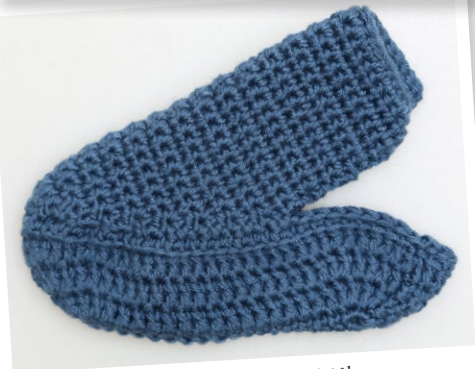
Det færdige Overstykke på Sålen.