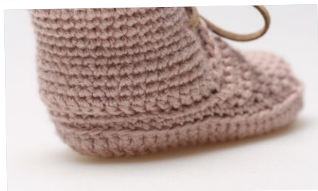
Hælkappen syet på Sålen.