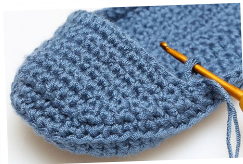
Her startes på 10. række af Overstykket.